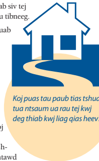
Koj puas tau paub tias tshuaj tua ntsaum ua rau tej kwj deg thiab kwj liag qias heev?